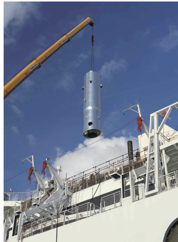
就航船へ搭載されるスクラバータワー